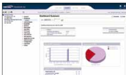
„360°“ Benutzerdefinierte Ansichten zeigen mehrere Übersichtsreports in anschaulicher Form.