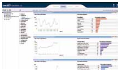
Übersicht Angriffe Mithilfe der SonicWALL Abo-Services lassen sich Informationen über abgewehrte Angriffe abrufen.