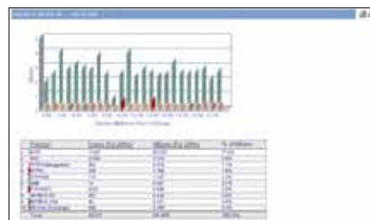
Dienste, Protokolle und Anwendungen Die Benutzer können den Netzwerkverkehr nach Kategorien aufgeschlüsselt anzeigen. Auf dieser Grundlage können bestimmte Verkehrsarten ausgeschlossen werden, um die Netzwerk-Performance zu verbessern.