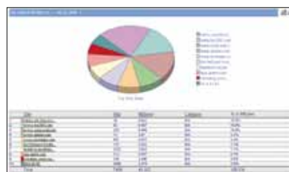
Web- und Anwendungsnutzung Mit diesem Report lassen sich sämtliche Aspekte des Internet-nutzungsverhaltens im Netzwerk darstellen. Sie können ablesen, wie lange Mitarbeiter im Internet surfen, Sie erkennen exakt, welche Websites und welche Anwendungen zu welchem Zeitpunkt aufgerufen werden, und sehen verdeckte Nutzungsmuster.